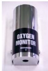
分離センサ用受け金具