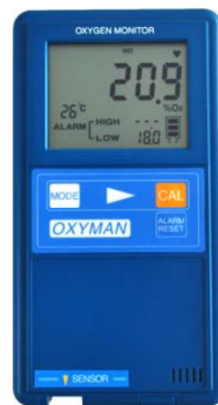
※写真は OM-25MS01(内蔵センサ)

酸素欠乏警報に特化した MS タイプ(型式 OM-25MS□□)と、酸素欠乏警報モードとフリーな酸素濃度計測モードが切替可能な MF タイプ(型式 OM-25MF□□)をラインナップしています。 ※OXYMAN シリーズ全機種で選択可能となっているシンプルモードでは、酸素濃度が 18%以下になると内蔵ブザーによる警報音により注意を呼びかけます。