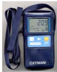
携帯用ソフトケース