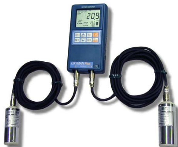
※写真は OM-25MP20(分離センサ × 2ch)

1 台で 2ヶ所の酸素濃度を計測できるセンサ 2ch 品をラインナップしているのも OXYMAN Plus の特徴です。