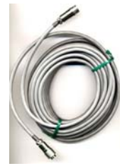
分離センサ用延長ケーブル(10m)